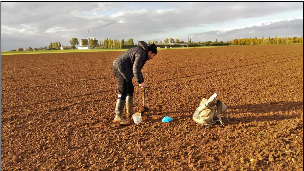
Photo 8 : vue du bout de l'axe N-E depuis le point de prélèvement n°12