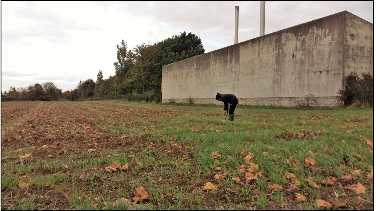
Photo 19 : départ de l'axe SO, parcelle B1-P4 (point de prélèvement n°31)