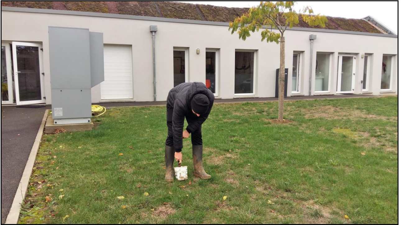
Photo 28 : axe Ouest point de prélèvement n°40, pelouse rue de Pithiviers à l'arrière du cabinet médical.