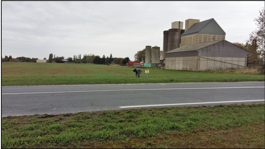
Photo 14 : vue du point de prélèvement n° 21 (parcelle et bord de route RD97)