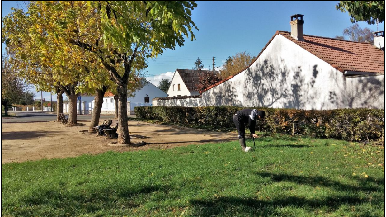
Photo 33 : axe Nord-Ouest, vue sur la place située rue Neuve, point de prélèvement n°46 sur pelouse