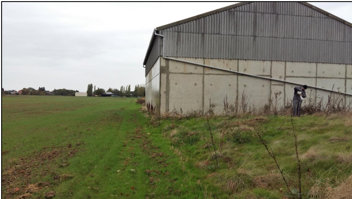
Photo 13 : vue du point de prélèvement n°20 (zone avec apport de terre ou brassage profond du sol)