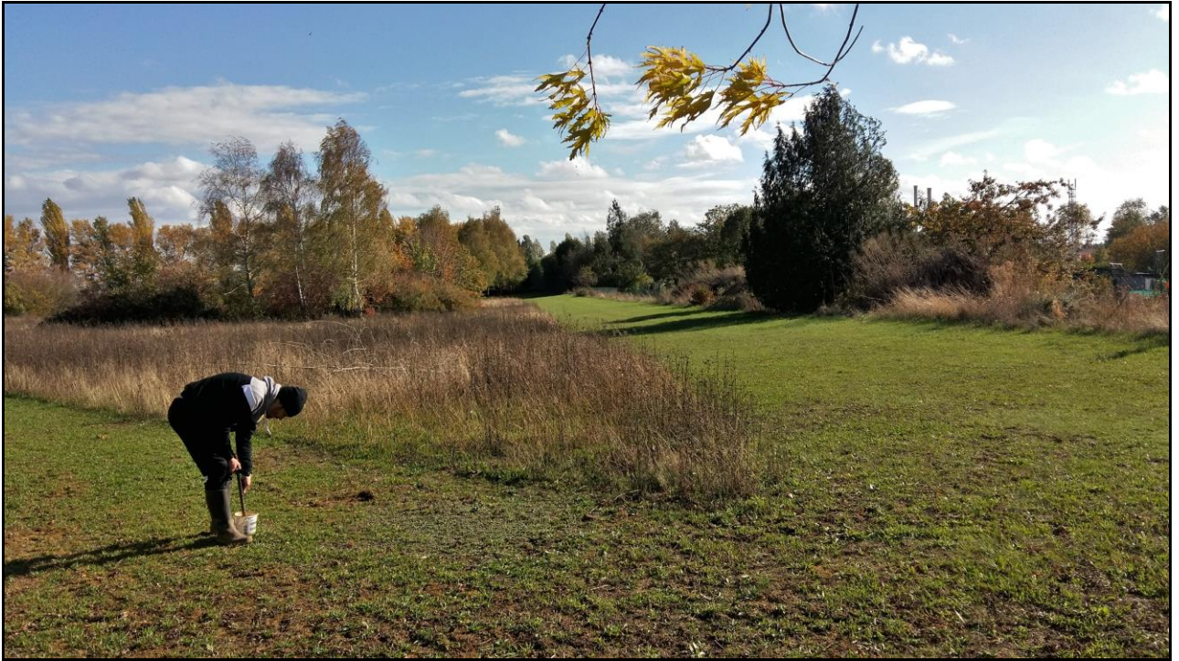
Photo 35 : vue du point de prélèvement n°48 à l'extrémité de l'axe Nord-Ouest (pelouse d'un parc public)