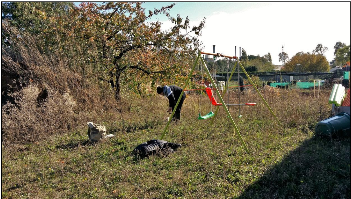
Photo 34 : axe Nord-Ouest vue vers l'usine, point de prélèvement n°47 dans la pelouse d'un particulier