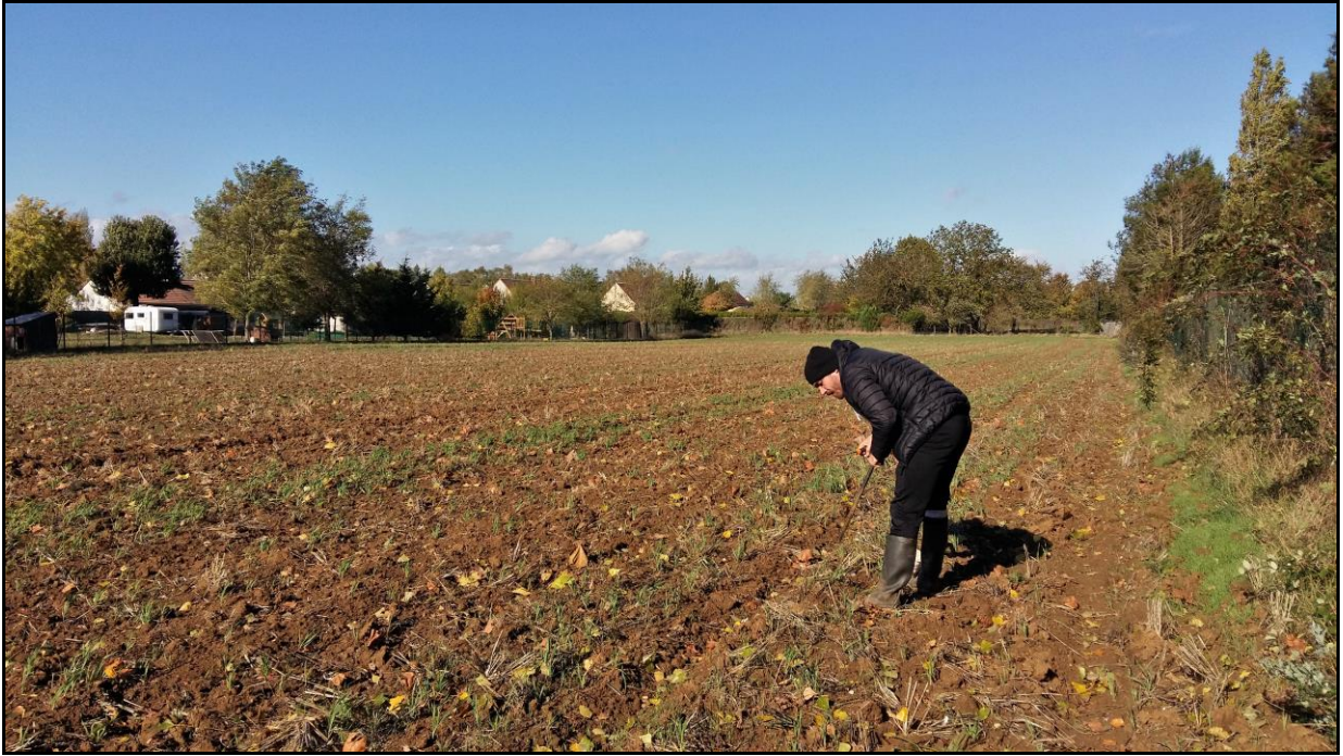
Photo 31 : point de prélèvement n°43 au début de l'axe Nord-Ouest, vue direction Nord-Ouest (parcelle B1-P4)