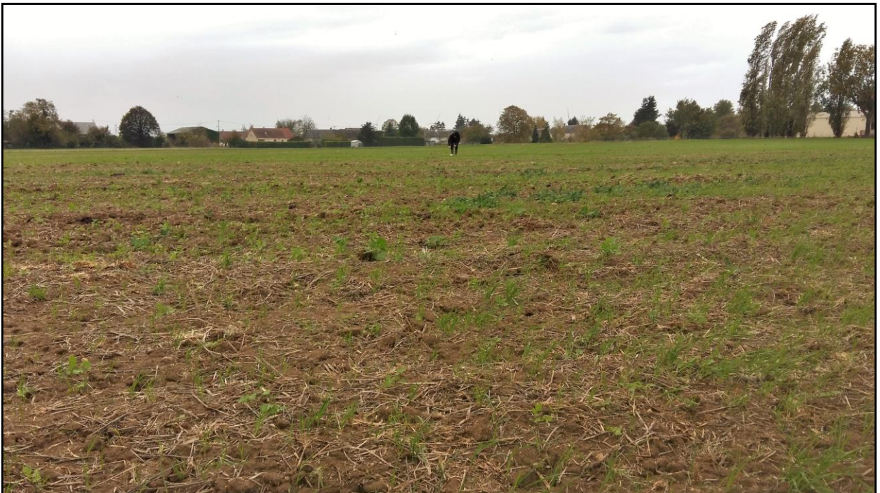
Photo 22 : sur axe Sud-Ouest, vue vers le Sud-Ouest (point de prélèvement n°33)