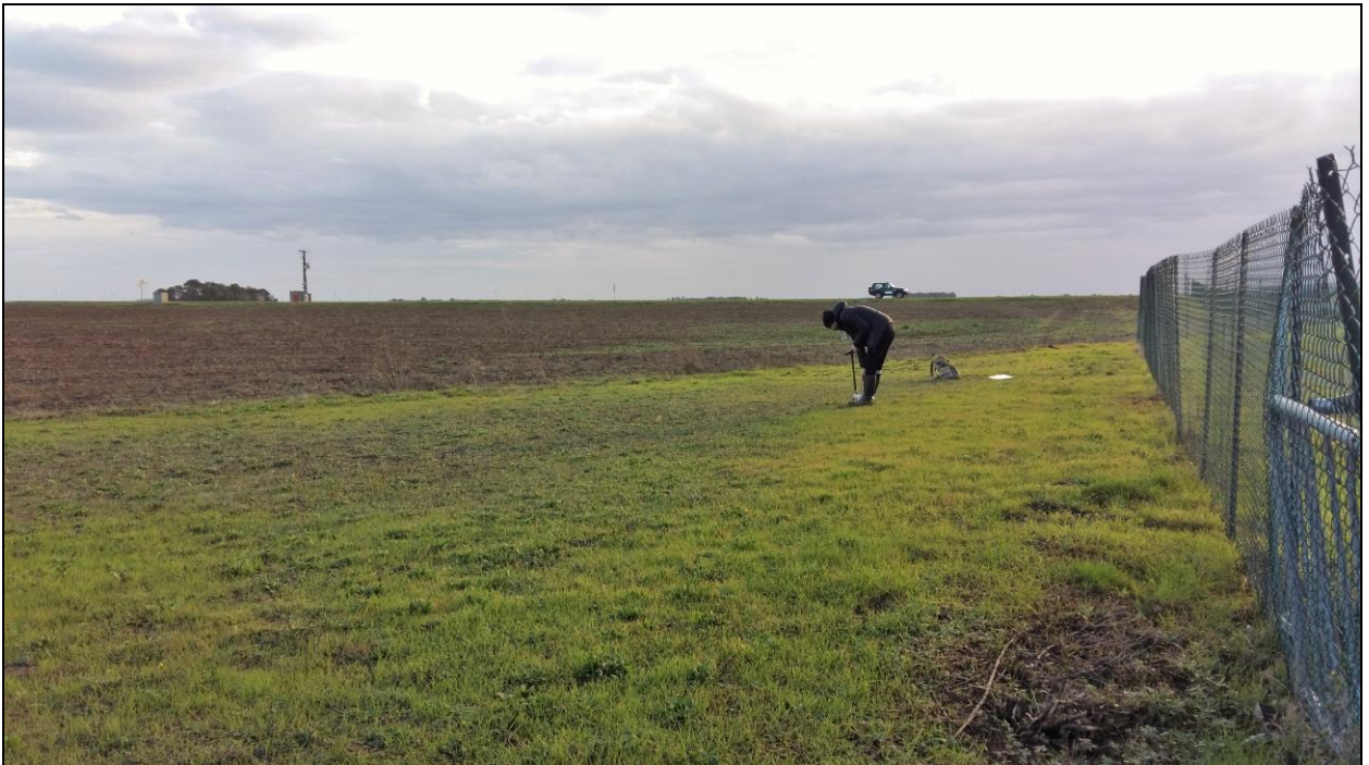
Photo 4 : vue d'ensemble axe NE depuis le point de prélèvement n° 7