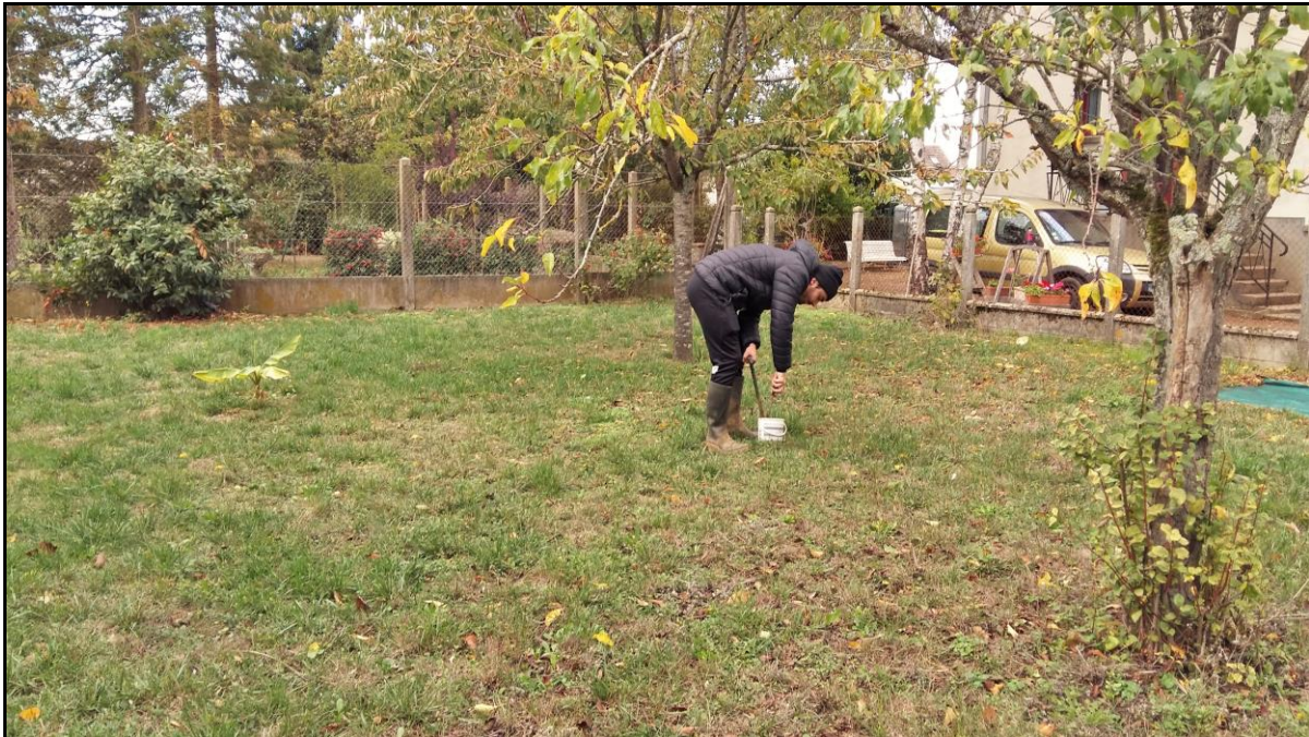
Photo 27 : axe Ouest, point de prélèvement n°39, pelouse habitation rue Neuve