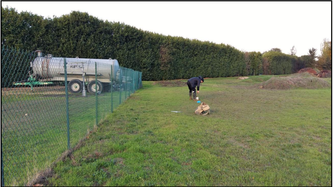
Photo 3 : point de prélèvement n°7, 1 er point de l'axe NE, zone enherbée de la station d'épuration