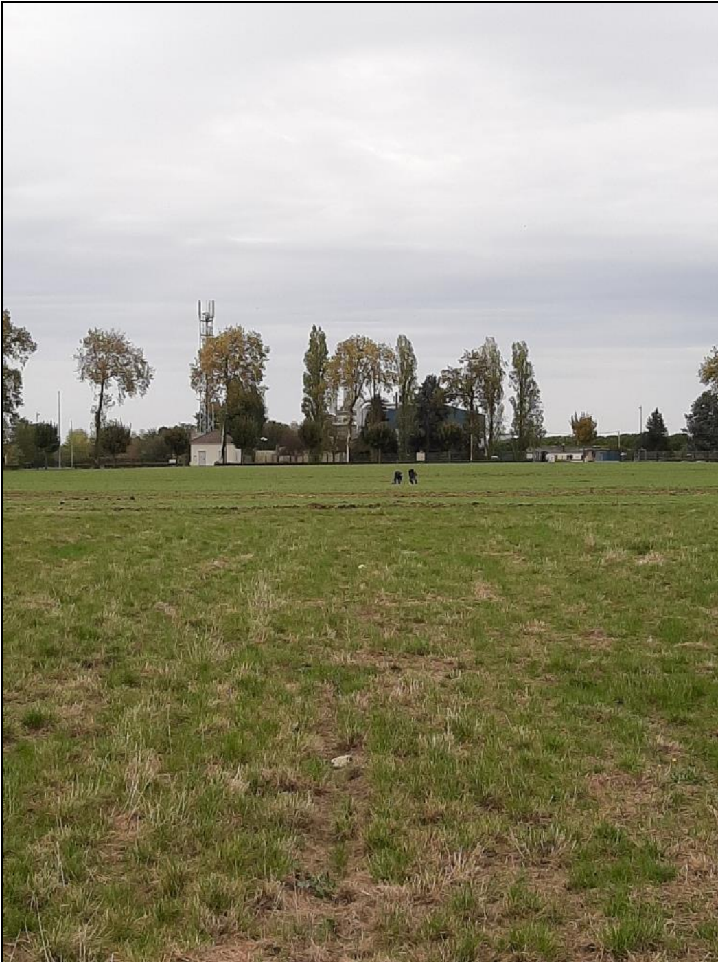
Photo 18 : vue d'ensemble de l'axe sud depuis son extrémité vers l'usine STCM (point de prélèvement n°30)