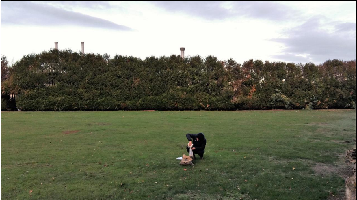
Photo 9 : Axe Est point de prélèvement n°13 sur une zone de pelouse faisant partie de l'usine STCM Bazoches