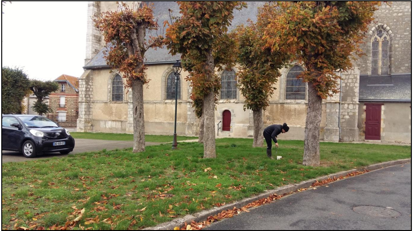
Photo 30 : extrémité de l'axe ouest point de prélèvement n°42, pelouse au pied de l'église de Bazoches.