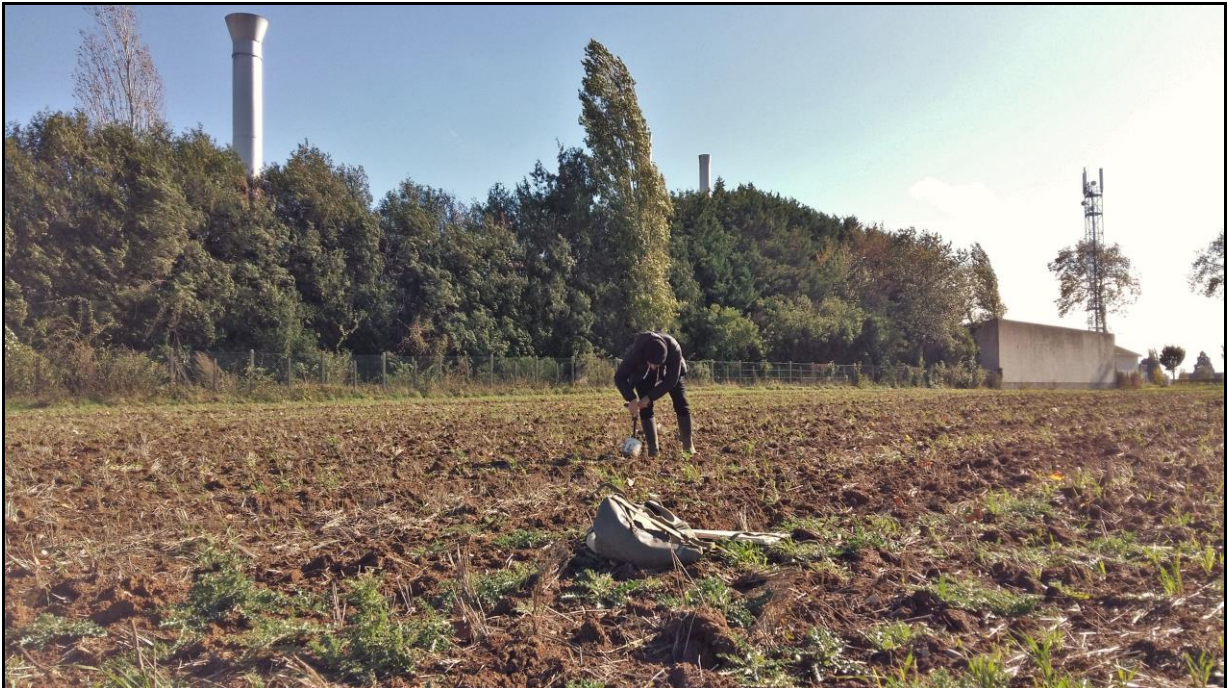
Photo 32 : axe Nord-Ouest, vue vers l'usine depuis le point de prélèvement n°43