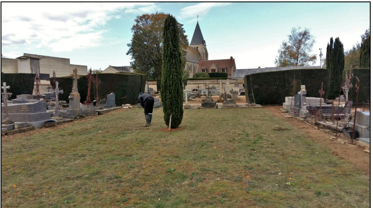
Photo 29 : axe Ouest point de prélèvement n°41 : pelouse au centre du cimetière municipal