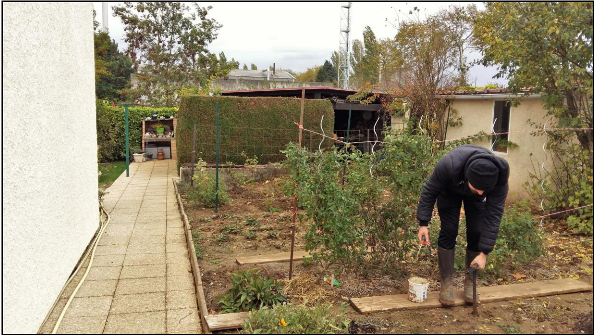
Photo 26 : axe Ouest, jardin de M. Dérroualle (point de prélèvement n°38) (terre rapportée en 2012)