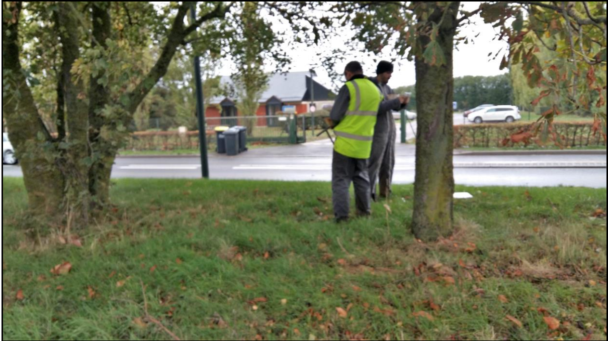
Photo 12 : vue du point de prélèvement n°19 (devant le silo), début de l'axe Sud-Est