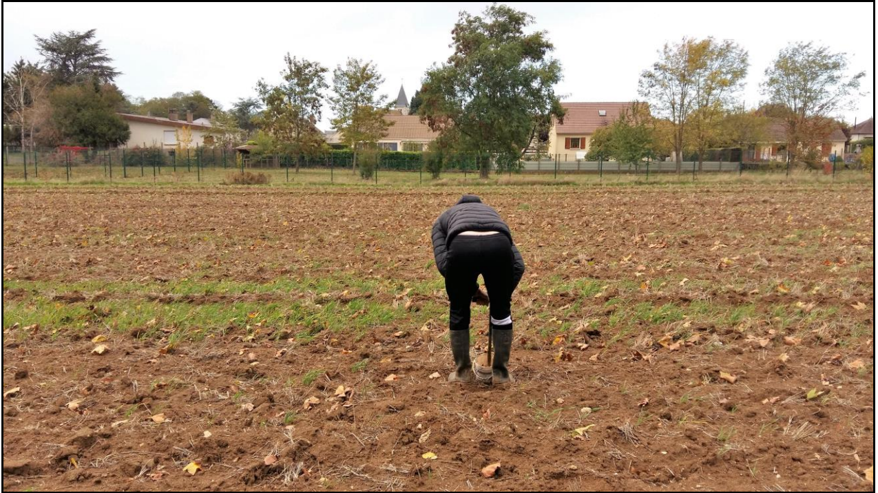
Photo 25 : Axe W au point de prélèvement n°37, vue vers l'Ouest (haut de page), vue vers l'usine (bas de page)