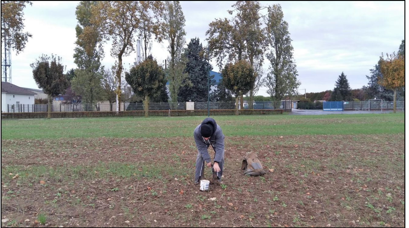
Photo 16 : départ de l'axe Sud depuis le point de prélèvement n°25