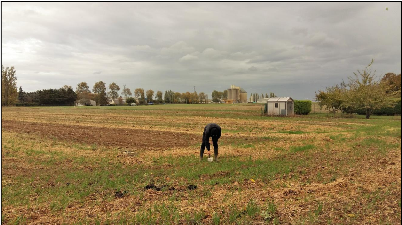
Photo 24 : point de prélèvement n°36, vue sur l'axe Sud-Ouest depuis son extrémité.