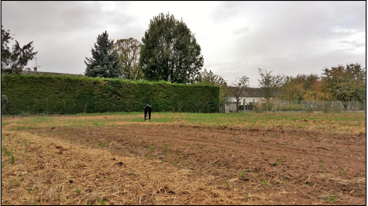
Photo 23 : point de prélèvement n°36 à l'extrémité de l'axe Sud-Ouest.